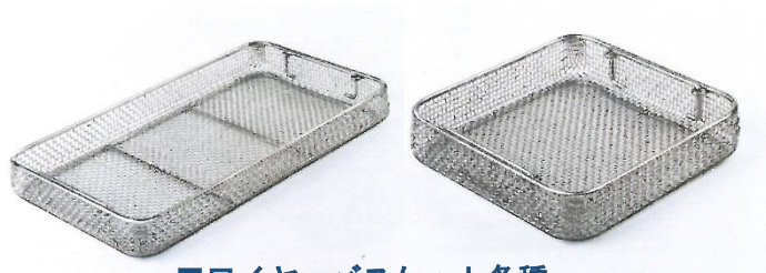
■ワイヤーバスケット各種 ※コンテナのサイズに合わせて ご提案させていただきます