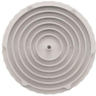
コンテナ蓋にラビリンスディスクを装着した際の断面図