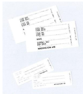
■インジケーターラベル